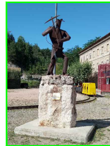
MINES DE CERCS (SANT CORNELI)